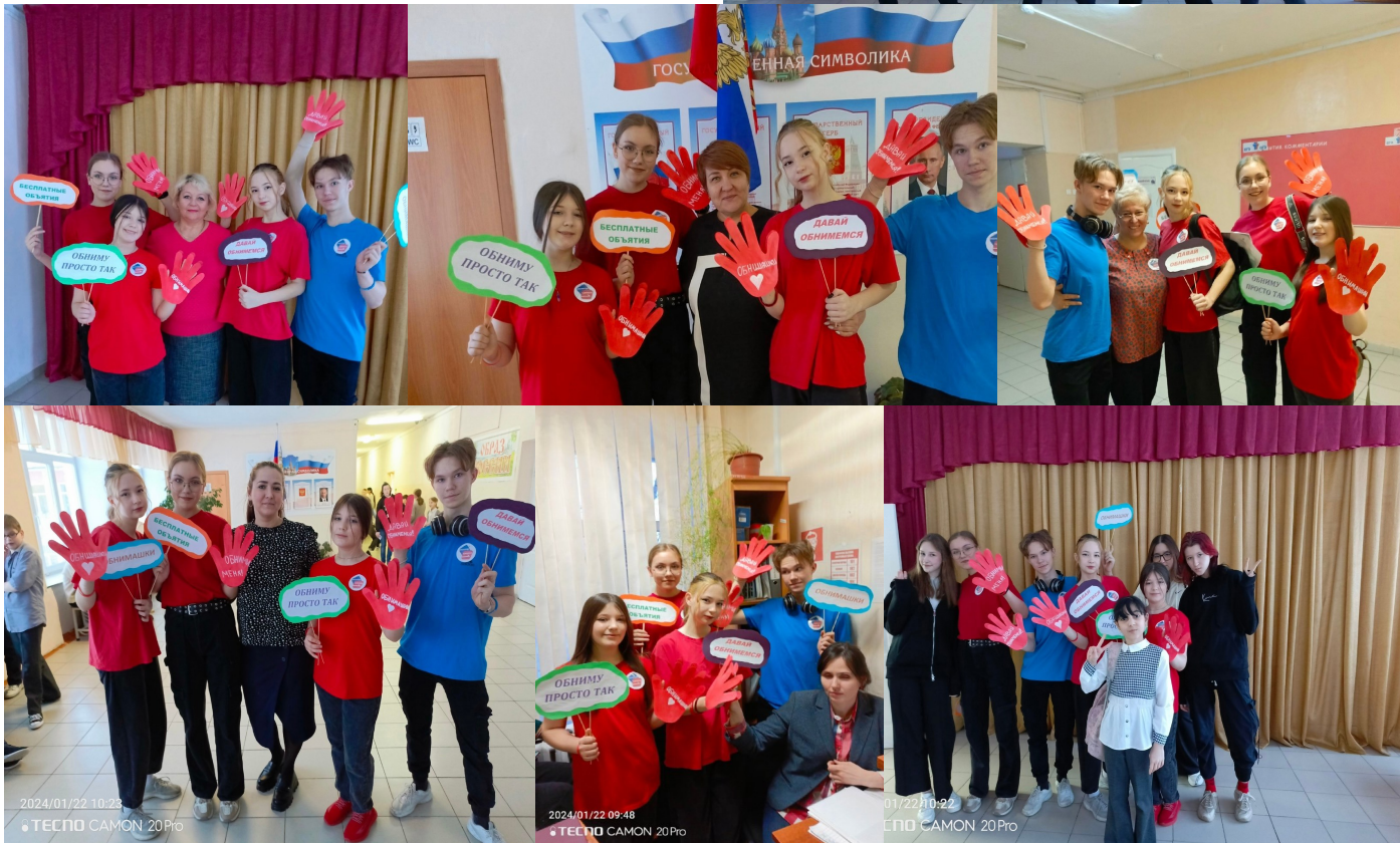
2024/01/22 10:23 ТЕСПО CAMON 20Pro